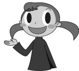
北社協マスコット アイちゃん