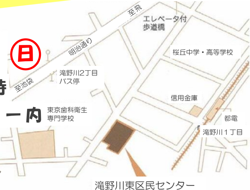
滝野川東区民センター