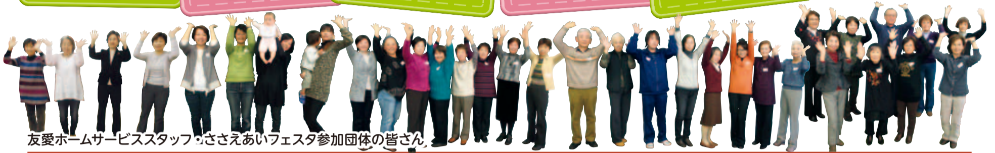
友愛ホームサービススタッフ、ささえあいフェスタ参加団体の皆さん