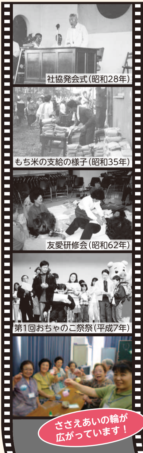
社協発会式(昭和28年)