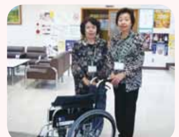
西が丘ふれあい館車イスステーション

区内に152カ所(町会自治会122カ所、その他30カ所)あります。 (H25.8.31現在)