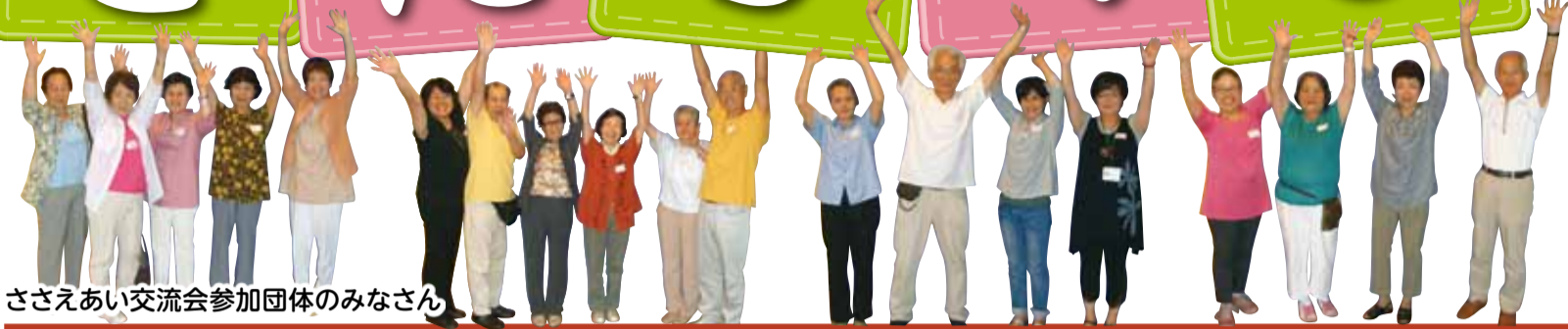
ささえあい交流会参加団体のみなさん