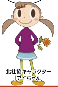
北社協キャラクター「アイちゃん」