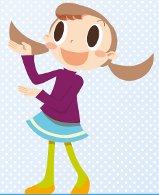
第4次北区地域福祉活動計画 (第II期 令和6年度～令和8年度)