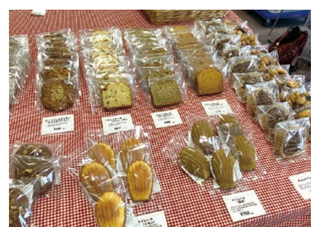
福祉事業所の焼き菓子販売