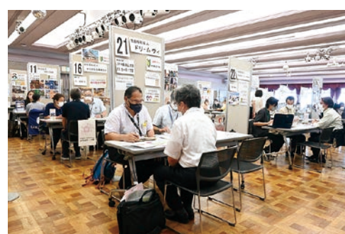
採用担当者との相談・面接

本イベントでは高齢・障がい・保育等の福祉分野の採用担当者と直接お話しができます。仕事内容についてよくわからない方は相談のみの参加も可能です。また、福祉の仕事が未経験・無資格の方のご参加も大歓迎です!焼き菓子等の物品販売コーナーもあります!たくさんの方のご来場お待ちしております。