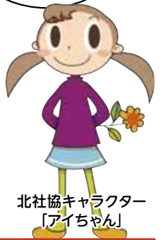
北社協キャラクター 「アイちゃん」