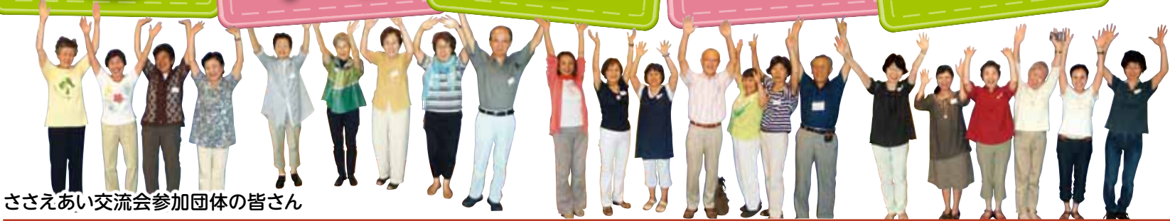
ささえあい交流会参加団体の皆さん