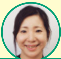
CSW(東十条・神谷地域) 飯野