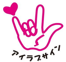
世界共通の合言葉 アイラブサイン

おちゃのご祭祭は、みんなが暮らすこのまちをより良くしていきたいとの想いで活動している、さまざまなグループや個人が集まったお祭りです。 アイデアとパワーが満載！模擬店、バザーの他に、イベントや情報がいっぱいです。