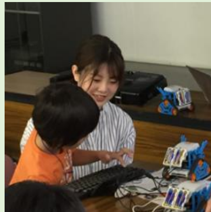
画像は、令和元年職業体験イベントのものです

その他にも地域の協力ボランティアが参加され、多様な世代の大人と子ども達が関わることのできるプログラミング講座です。