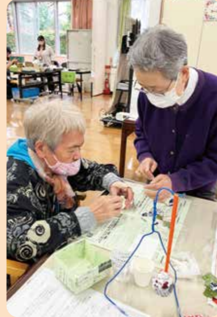
サークルローズマリー体験コーナー