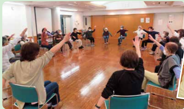
みんなで一緒に課題を考えながら取り組みます!