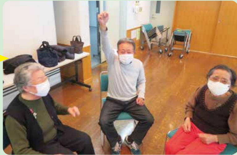
難しい課題をクリアして、思わずガッツポーズ!