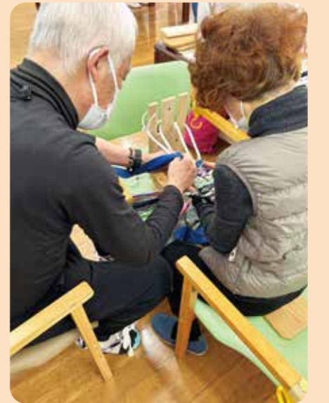
布ぞうり体験コーナー