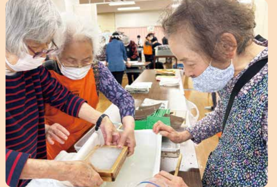
紙漉き体験コーナー