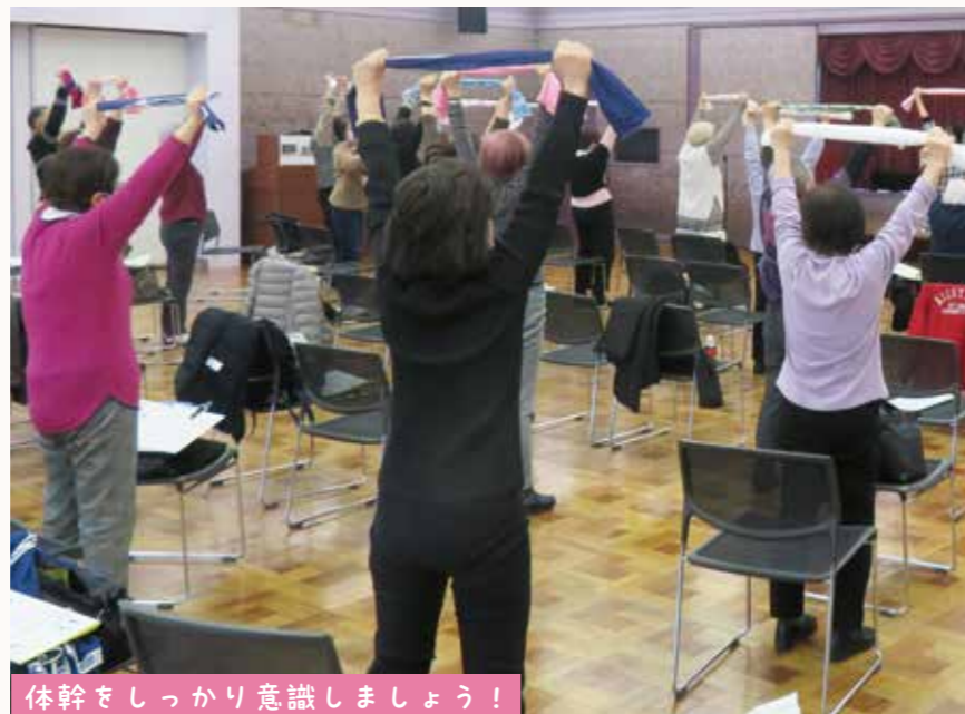
体幹をしっかりと意識しましょう！

ぷらっとほーむでは講座の開催や出前講座での訪問などを通して自主グループ活動を応援しています！