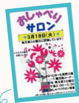
ボランティアさん自作のチラシです！

毎月第3火曜日に開催の『おしゃべりサロン滝東』。このサロンの魅力はお茶もお菓子もなし、プログラムもなしで、「とにかく『おしゃべり』をメインにしているところですよ！参加者からは『落ち着いてじっくりと話をできるのがいい』『話をするのは苦手ですが、ここに来ると喋ってしまう。毎月楽しみます』『他の人の話を聞くのも楽しい。いろいろな情報を得ています』等の声。サロンを運営するのは『おしゃべりだけのサロンをしよう』と立ち上がった、傾聴ボランティアを中心としたメンバーの皆さん。参加者のお話を丁寧に受け止め、時には緒に大笑いしながら楽しい時間を過ごします。 「おしゃべりだけで皆さん十分に楽しんでいる。人と会って話をするのがとても大事ですね」「サロン開始から1年、おしゃべりだけでやっていける自信ができました」など、メンバーの皆さんは手ごたえを感じているようです。 ぜひ皆さんも、おしゃべりを楽しみにいらしてください！