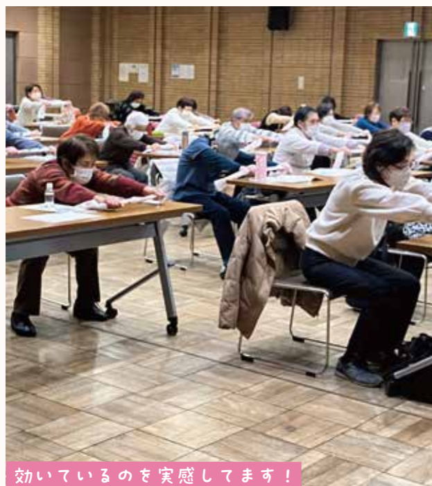
効いているのを実感しています！

北区で活動されている自主グループの多くが活用している「北区」近所体操」。 今回の自主グループフォローアップ講座では、その近所体操の新バージョン、「手ぬぐい体操」の体験・レクチャーを実施いたしました！ 桐ヶ丘・滝野川東それぞれ開催し、45グループ77名の方が参加。手ぬぐい体操は、姿勢や握力、手の力を維持向上させることを目的とし、主に体幹、腕や手を動かす体操で構成されています。受講された皆さんからは「みんなで取り組めば楽しく出来そう」「しっかりとやると結構きつい。効果を実感しました」「運動の仕方がよく分かりました」「明日の活動で、早速やってみます」など、様々な感想をいただきました。 講座の様子を写真とともにお届けします！