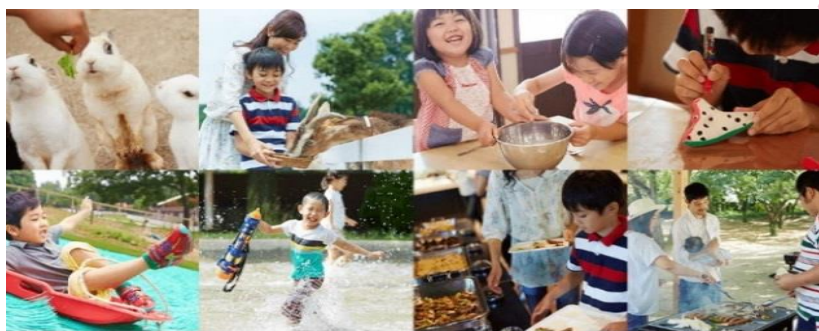
こもれび森のイバライド

この事業は、歳末たすけあい・地域福祉募金の配分金を財源に、ひとり親家庭の親子の触れ合いを深めていくこと、保護者同士の交流を促進していくことを目的に実施しています。