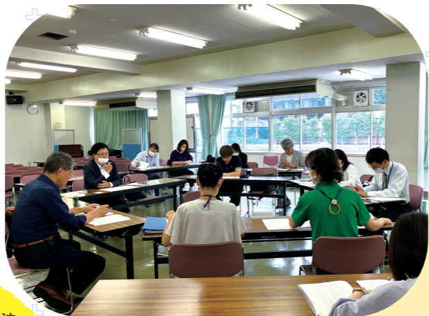
成年後見制度利用促進会議の様子