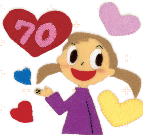
地域の方の作品 （アイちゃんアプリケ）