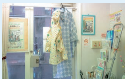
▲激しい雨の日でも「木のおもちゃサロン」の開催を楽しみにしている親子がいる