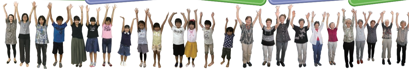
TOY BOX・ボランティアグループこだまのみなさま