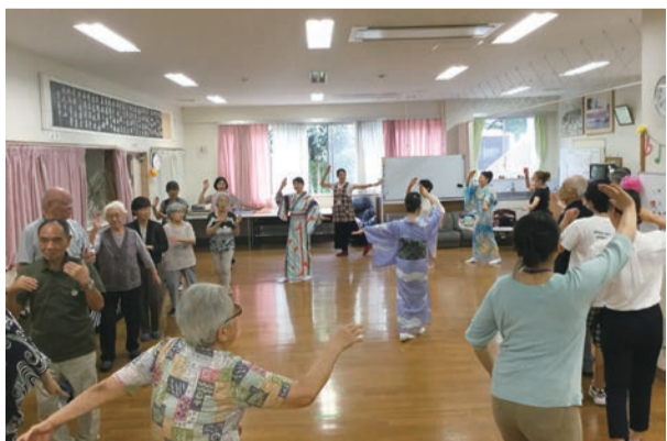
ぷらっとほーむ桐ヶ丘(地域の方々との交流)