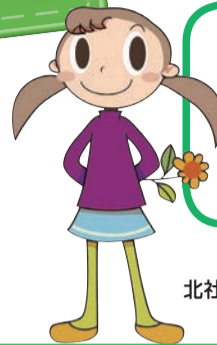
北社協キャラクター「アイちゃん」