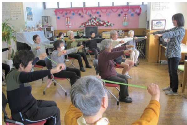
ぷらっとほーむ滝野川東(介護予防体操教室)