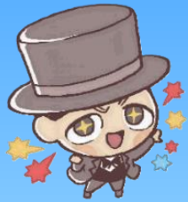
東京北区渋沢栄一プロジェクト 広報キャラクター しぶさわくん